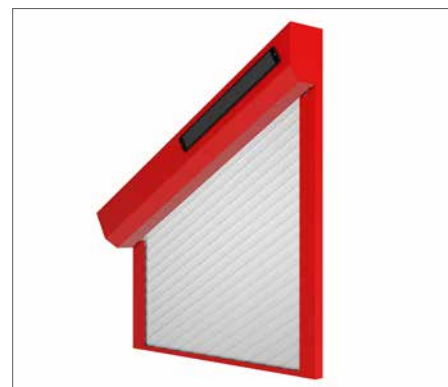
AsyRoll 4.0 EasyLine mit Solarpanel

Der Schrägrollladen der neuesten Generation funktioniert dank patentiertem Nippelsystem genauso wie ein konventioneller Rollladen. Leise fährt der Behang zum Schließen von oben nach unten und verdunkelt die gesamte Breite und Höhe.