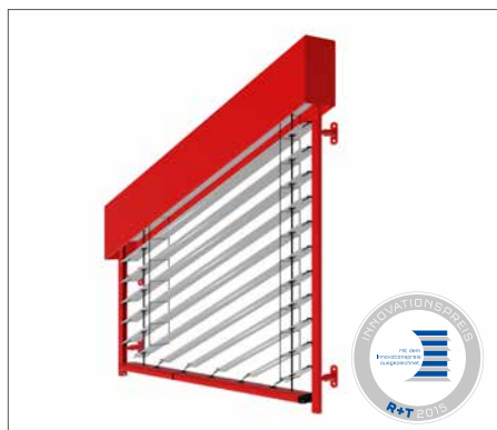
AsyFlex mit Führungsschienen