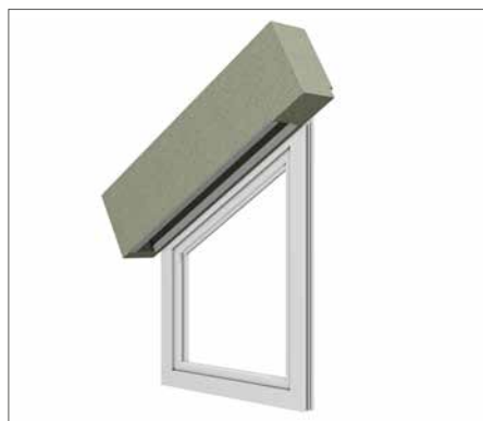
Vorbaukasten Combo AFV für AsyFlex

Der Schrägraffstore AsyFlex ist ein Raffstore mit variablem Lamellensystem.