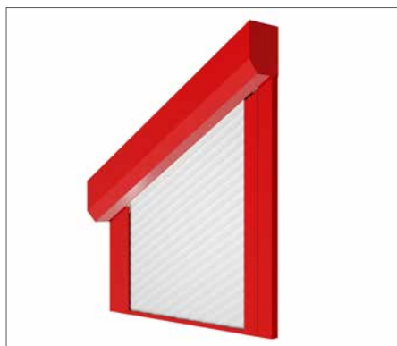
AsyRoll 4.0 mit PV-System